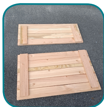
E - Pièces couvercle