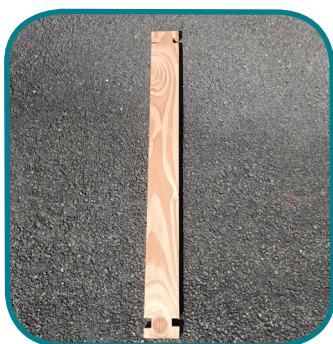
B - Lames (22)