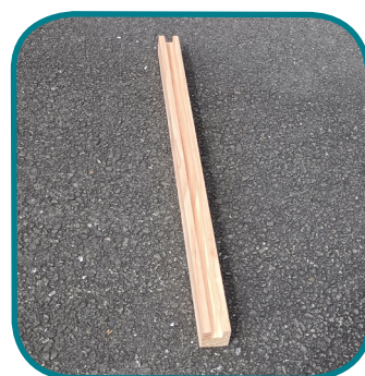
F - Montants trappe (2)