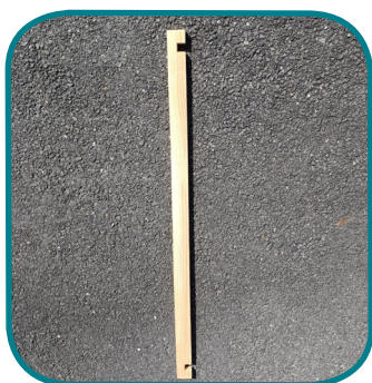
A - Demi-lames (4)