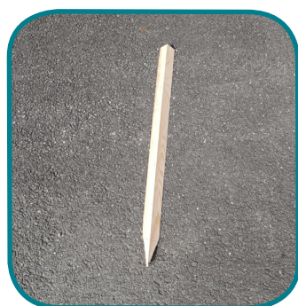
D - Piquets d'angle (4)