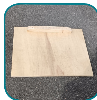
G - Trappe