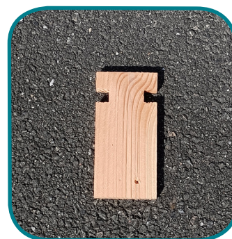
C - Lame de trappe (8)